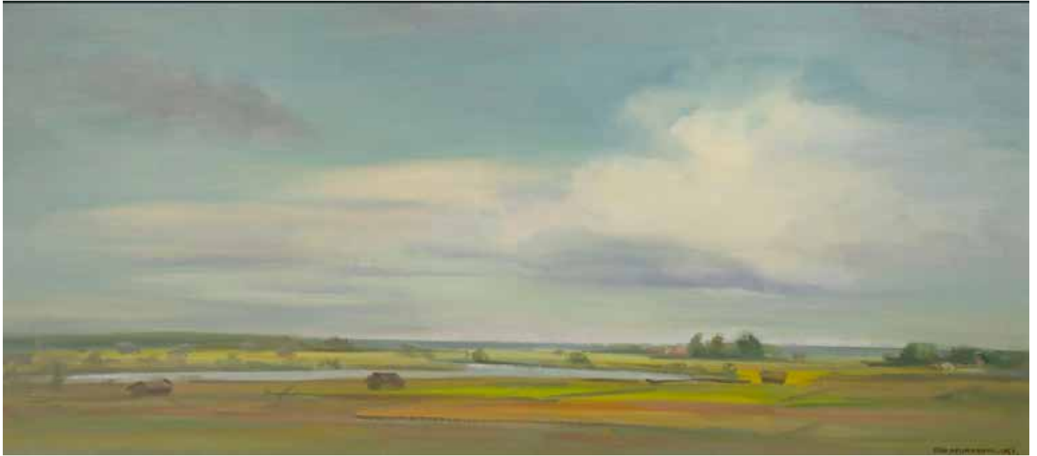
Eero Nelimarkka: Lakeusmaisema (1964). Taidekokoelma Timo Korkiamäki.