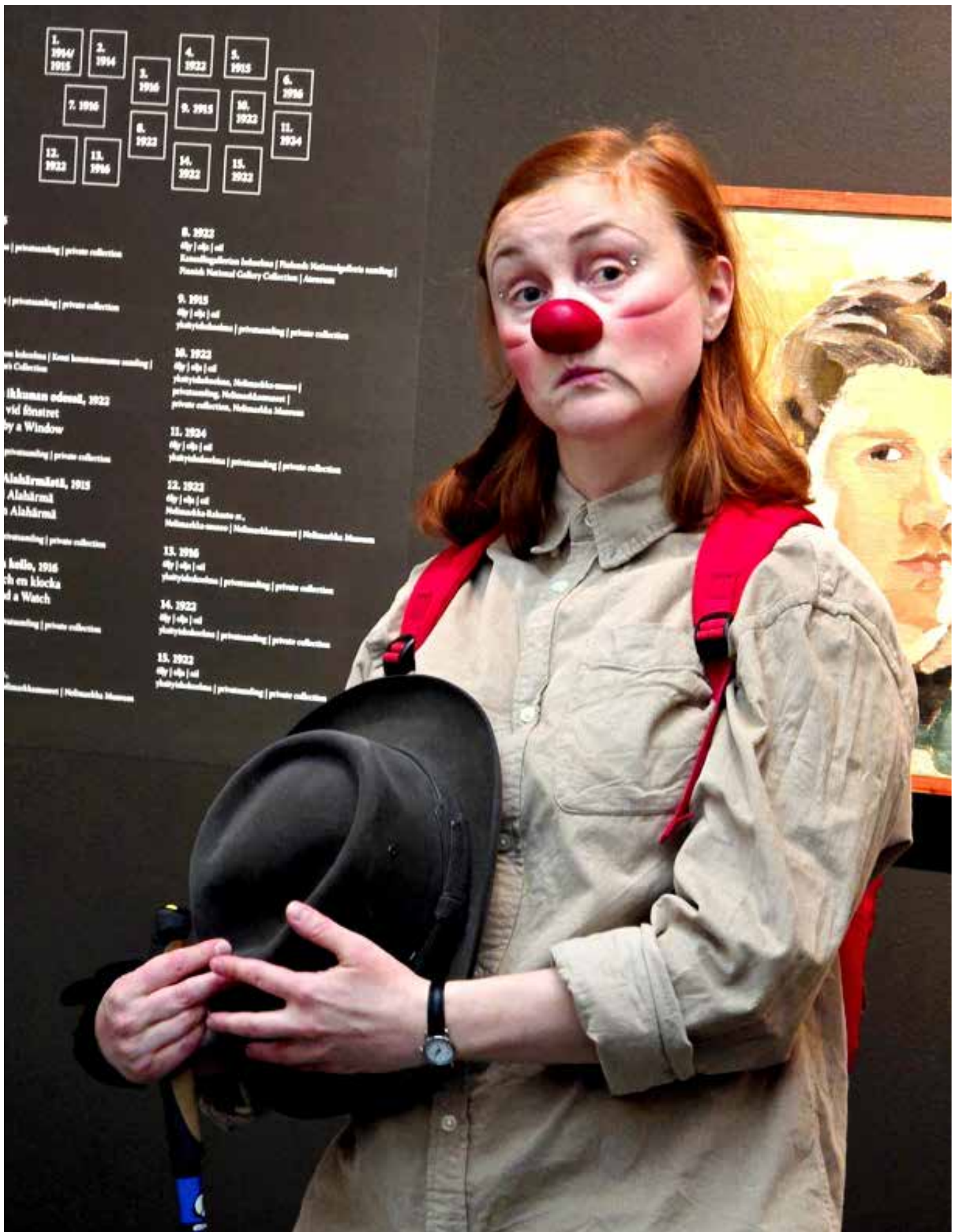
Lasten lauantai Ateneumissa 28.3.2026 Barnens lördag i Ateneum 28.3.2026 Childrens Saturday on March 28, 2026