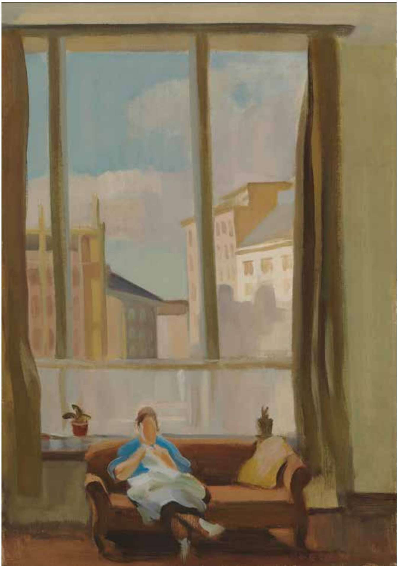
Eero Nelimarkka: Ateljeesta (1940). Kansallisgallerian kokoelma / Ateneumin taidemuseo, kokoelma Ahlström.