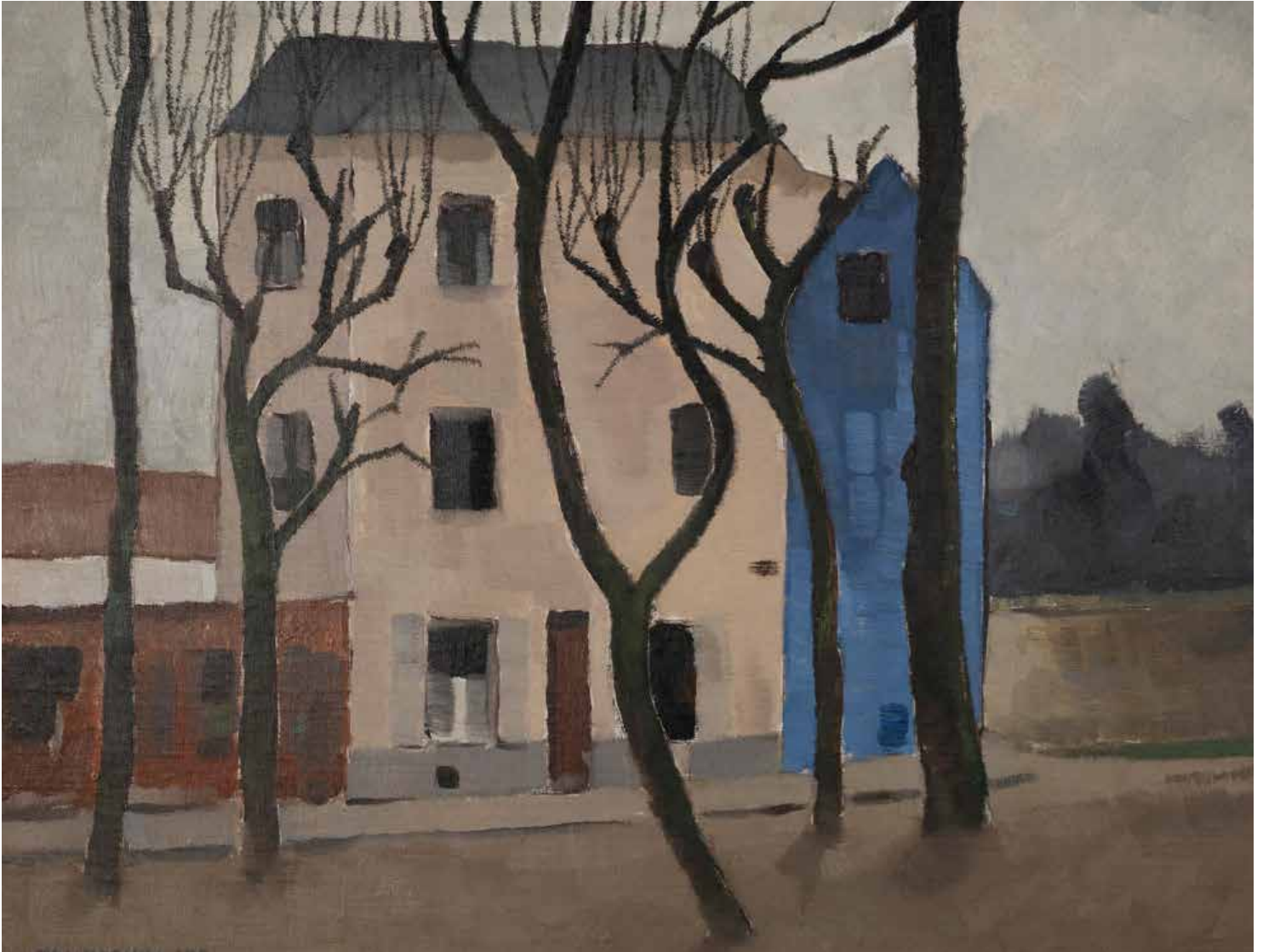
Eero Nelimarkka: Talo Ranskassa (1920). Nelimarkka-Rahasto sr., Nelimarkka-museo.