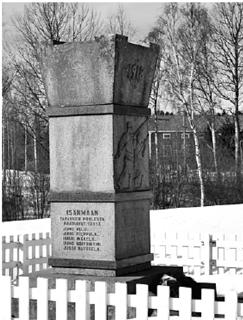
Minnesmärke i Hulmi, Laihela, till minne av den första striden i kriget. Monumentet avtäcktes den 7 augusti, 1938. På monumentet finns namnet på de fem skyddskårister som stupade i striden. Skulptör: Urho Kaarlo Lamminheimo