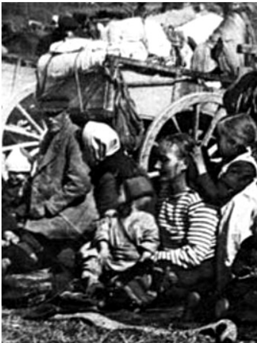
Fångar på Fellmans åker i Lahtis ("blodsåker") omkring 1 maj 1918, några av över 20.000.