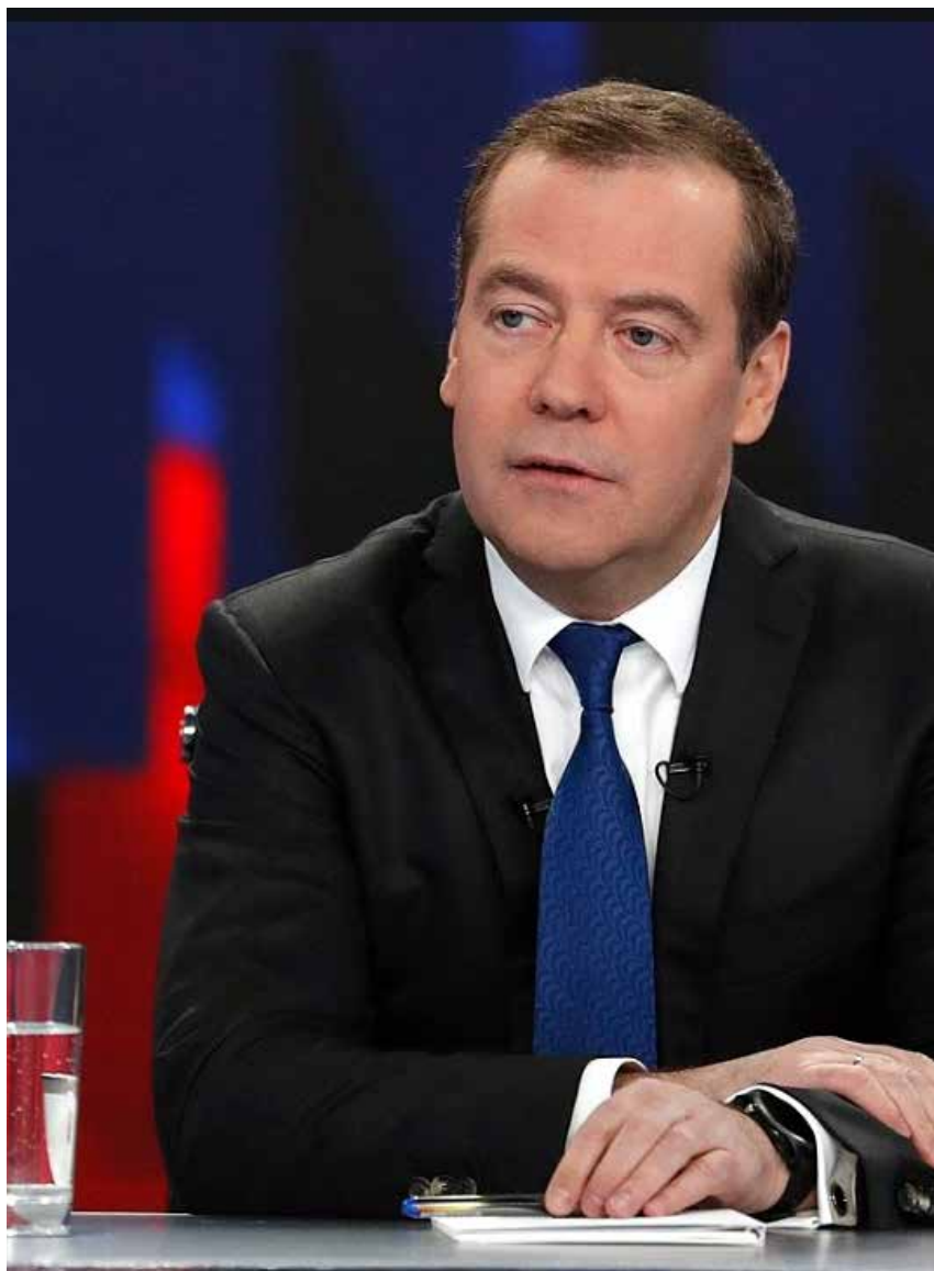
Expresident Dimitrij Medvedev den 5 december 2019 Foto: Dmitry Astakhov, Government of the Russian Federation- Licens; Creative Commons Attribution 4.0