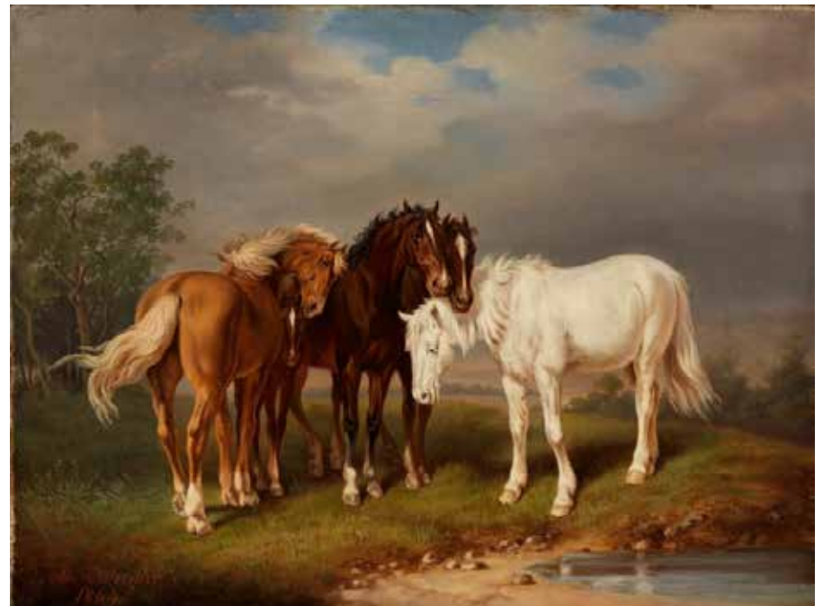
Magnus von Wright 13.6.1805, Haminalahti 5.7.1868, Helsinki Hevosia, jäljennös Carl Wahlbomin litografian mukaan, 1864 Kansallisgallerian kokoelma / Ateneumin taidemuseo

COPYRIGHT: The Presidential Office of Ukraine. All materials featured on this site are licensed under a Creative Commons Attribution-NonCommercial-NoDerivatives 4.0 International. The use of any materials posted on the website is permitted provided you link to www.president.gov.ua regardless of full or partial use of materials.