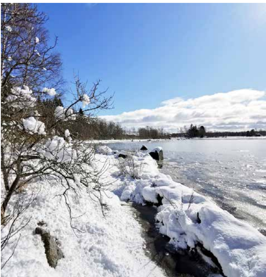
Talvi joka oli