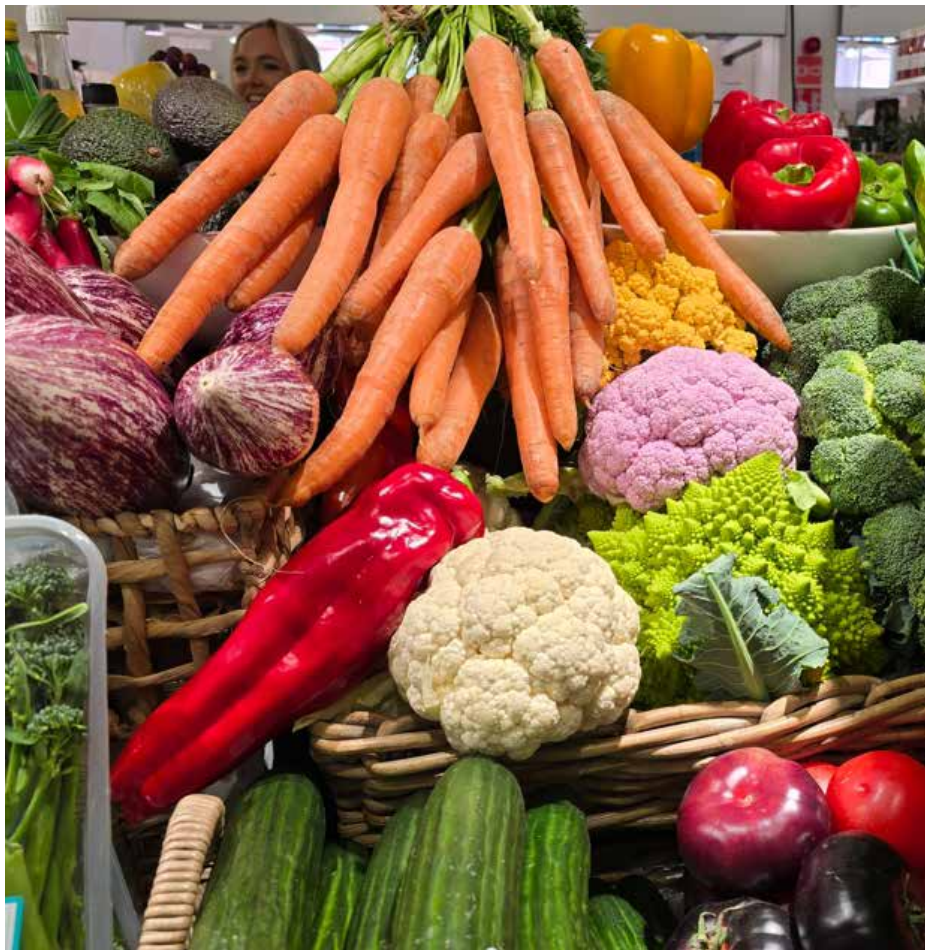
Terveellisesti syöminen ei todellakaan ole vaikeaa.